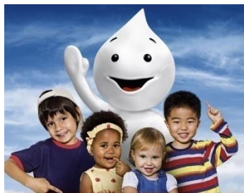
Programa de Vacinação